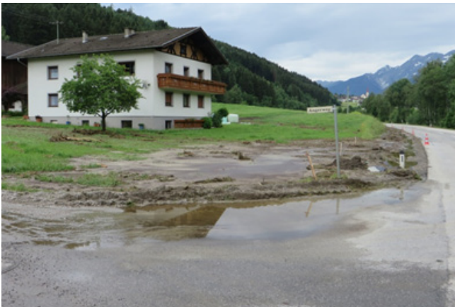
Situation Angerweg am 08.06.2015 nach ersten Aufräumungen durch BBA: Die Gerinne-Durchlässe zum Gießen sind auch bei durchschnittlichem Wasseranfall überlastet und neigen aufgrund des geringen Durchmessers immer wieder zum Verklausen; Maßnahmen seitens der Straßenverwaltung sind erforderlich.