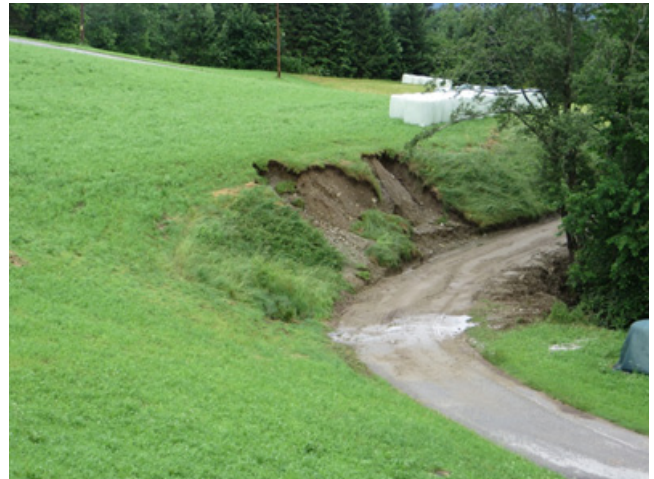
Ötztalerhöfe Zufahrt von Bärfall nach Ötztalerhöfe beim Kirchmair Wolfgang: Am Grundstück Kirchmair Johann: Böschungsbruch (Hangexplosion).