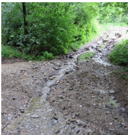
Gemeindeweg Fritzens – Bärfall: überlaufender Schacht mit anschließender Gerinneverlegung und Ausuferung/Erosion im Bereich des Gemeindeweges Fritzens-Bärfall, was in weiterer Folge zur Abdrängung des Vorfluters in der Bärfall mit Ausuferung in den Zufahrtsweg Grill-Roseler geführt hat.