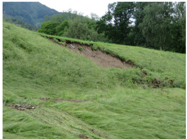
Wiesenweg Sprenger, Grundstücke Sprenger: mehrere Böschungsbrüche (Hangexplosionen) und Schäden durch konzentrierten Oberflächenwasserabfluß.