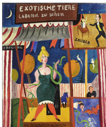
Rudolf Wacker, Die Schlangen-Königin , © vorarlberg museum

lädt alle Interessierten und Freunde der Chronik Flaurling zu einer Fahrt ins benachbarte Bundesland Vorarlberg ein. Dort werden wir durch zwei Ausstellungen geführt, die sich mit der Kunst der Zwischenkriegszeit beschäftigen.