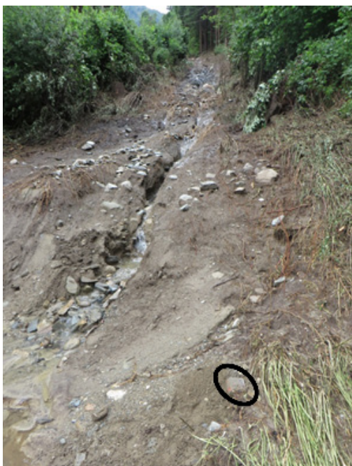
Murbruch unterhalb der Sprenger Wiese im Bereich Gemeindegrenze Flaurling-Polling: Böschungbruch mit Wasseraustritten (Hangquellen) und Gerinnebildung, Murgang bis zum Lederle; Ein Großteil des Ereignisses liegt auf Gebiet Polling, die Auswirkungen in der Talflur in Flaurling (Kreis Grenzstein Flaurling / Polling).