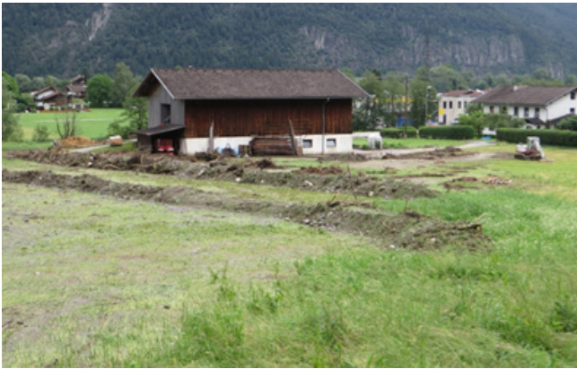
Ablagerungs- und Ausschotterungsbereich beim Lederle: am 08.06.2015 bereits in Sanierung stehend, Behelfsdämme gegen lfd. geschiebelasteten Wassereintrag aus der Hangflanke / Murbahn.